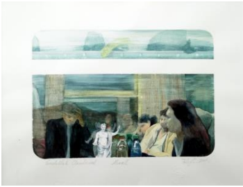
Vonatablak Claudiusszal c. akvarellem

2015-ben Balatonalmádiban megrendezett Balaton Tárlaton, Mikrokozmosz című fotómanipulációs technikával készült sorozatomat jutalmazta a zsűri.