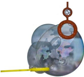
Mikrokozmosz c. sorozatom egy darabja

2015-ben Balatonalmádiban megrendezett Balaton Tárlaton, Mikrokozmosz című fotómanipulációs technikával készült sorozatomat jutalmazta a zsűri.